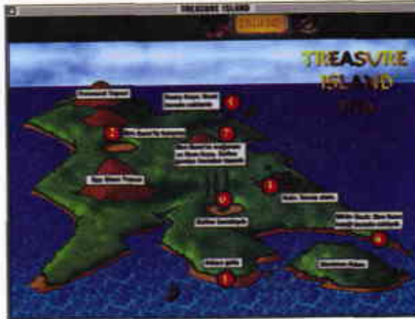
Hikayemizin geçtiği meşhur adanın planında adadaki önemli yerlerin isimleri gösteriliyor.

Son olarak inceleyeceğimiz cd nispeten daha ileri aşamadaki öğrencilere hitap edecek bir yazılım. Bir çalışma CD'si olmaktan ziyade okuma ve alıştırtma amaçlı olarak hazırlanmış. Konu olarak ünlü bir çocuk klasığı olan R. L. Stevenson'un Define Adası adlı eseri seçilmiş, yapı ve dil olarak bir hayli basitleştirilmiş, ancak tamamen anaokulu seviyesine indirgenmiş değil tabii, İngilizce içinde mevcut bulunan tüm temel kalıpları ve yapıları öğrenciye verebilecek şekilde hazırlanmış. Burada bol miktarda illüstrasyon kullanılmış, bunun yanı sıra arka planda oldukça düzgün ve dikkatli bir İngilizce ile kitap seslendirilmiş. Eğer isterseniz ekranın altındaki bir tuşa basarak konuyu hem sesli, hem de açılan bir