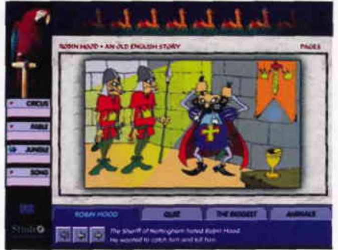
“Adım Adım İngilizce”de çeşitli İngilizce hikayeleri değişik seviyelerde dinleyebilirsiniz.

İşte ilginç bir yazılım, tabii çoğu gibi yabancı kökenli bir eser. Hem PC, hem de Macintosh bilgisayarlar da çalışacak şekilde hazırlanmış. Windows altında doğrudan CD üzerinden çalışıyor, yani herhangi bir kurulum gerektirmiyor. Konu olarak küçük bir şehir seçilmiş. Ekranda bu şehri görüyorsunuz, altta ise birkaç düğme var. Quit tuşu programdan çıkmaya, City ana ekrana dönmeye, Find otomatik kelime bulucuyu çalıştırmaya ve Test küçük çaplı bir sınav gerçekleştirmeye yarıyor. Çizimler tamamen elle yapılmış, seslerse gerçek hayattan kayıt. Bir sözlükten ziyade macera oyununa benziyor ki, amaçlanan da zaten bu. Binalar ve kapılara tıklayarak şehirde dolaşıyorsunuz, etraftaki pek çok nesnenin ismi yanlarındaki kutucuklarda yazılı ve bunlara tıkladığınız zaman