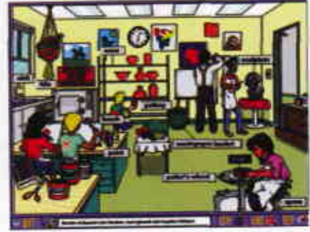
“İnteraktif Sözlük” İngilizce kelimelerin görerek öğrenilmesini sağlıyor.

pencere vasıtasıyla yazılı olarak takip edebiliyorsunuz. Fakat ağırlık sesli anlatıma verilmiş, bu iyi bir adım ve aynı hikayeyi bir kitaptan okumaktan daha üstün yanları var. Dil öğreniminde her zaman için en önemli olan ve hep ihmal edilen unsur öğrenciye pratik alıştırtma yaptırılmasıdır, bu ise sadece cümle kurmakla olacak iş değildir. Öğrencinin öncelikle kulağı öğrendiği dili duymaya ve deşifre etmeye alıştırtmalıdır. Define Adası anlatılan konunun yazılı olarak takip edilebilmesi aracılığıyla kulak ve göz arasında kurulan bağı güçlendirme imkanı tanıyor, bir defa belirli telaffuz kuralları çözüldüğünde genellemeye giderek duyu-