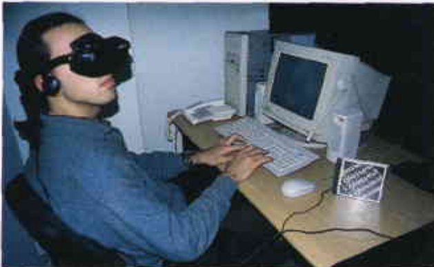
i-Glasses'ı sizler için test ettik