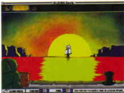
“Define Adası”nda hikaye hoş grafikler eşliğinde anlatılıyor.